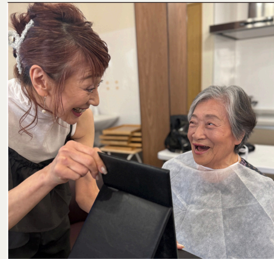
ビューティーデイ