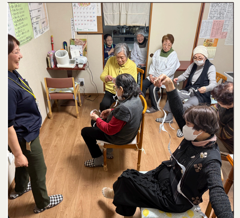
ほっこり庵 認知症カフェ